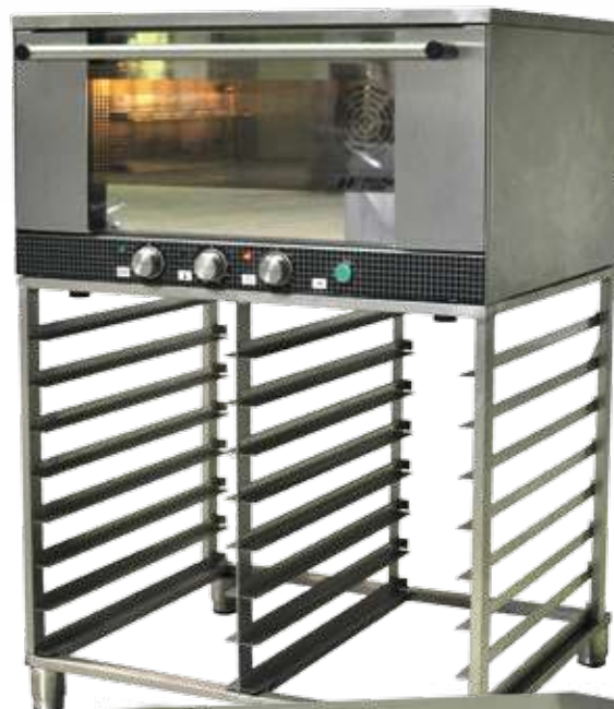
1 Powersnack 2